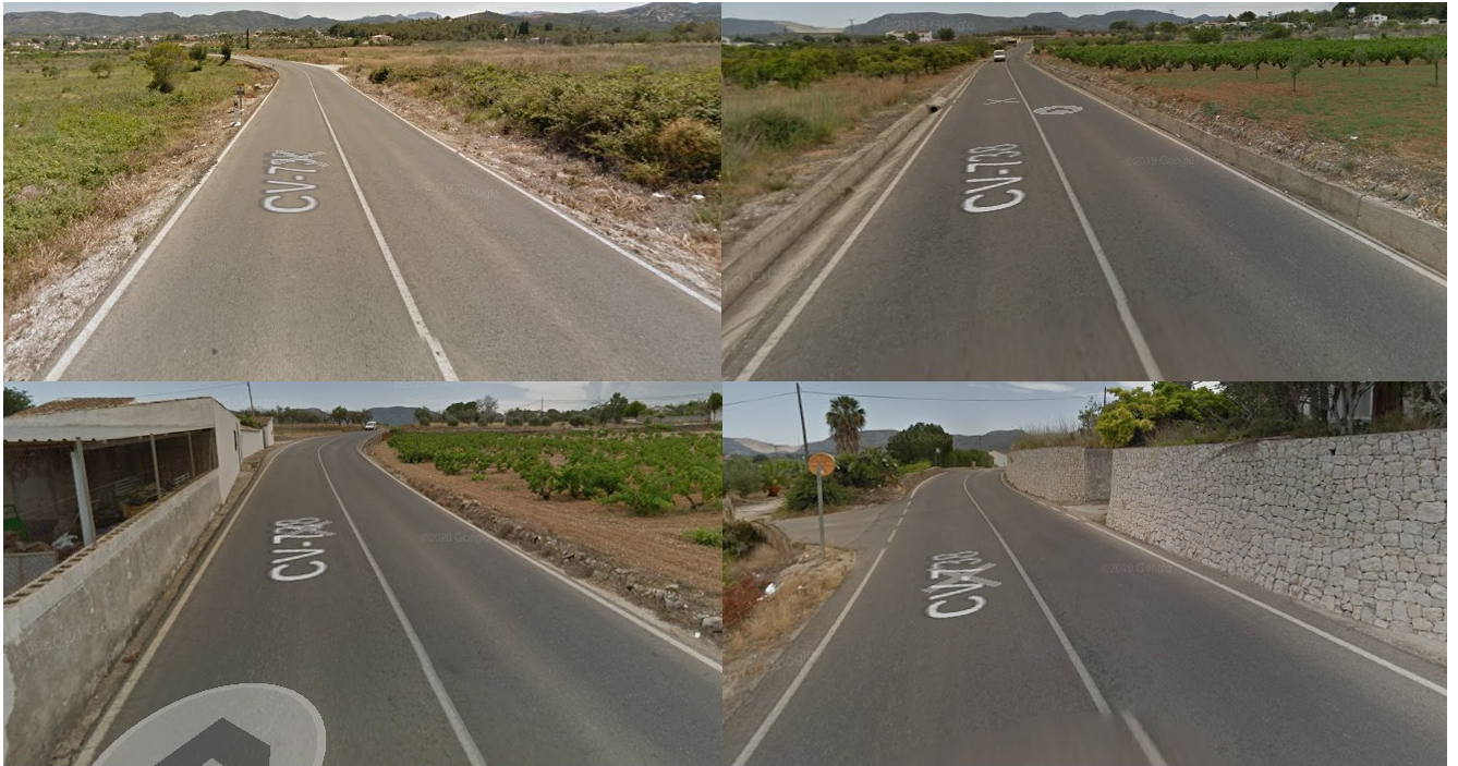
CV-738 Gata de Gorgos - Jesús Pobre, márgenes.