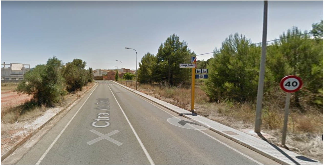
Señal de limitación de velocidad entrando por el norte

- Efectivamente hay señales de limitación de velocidad: