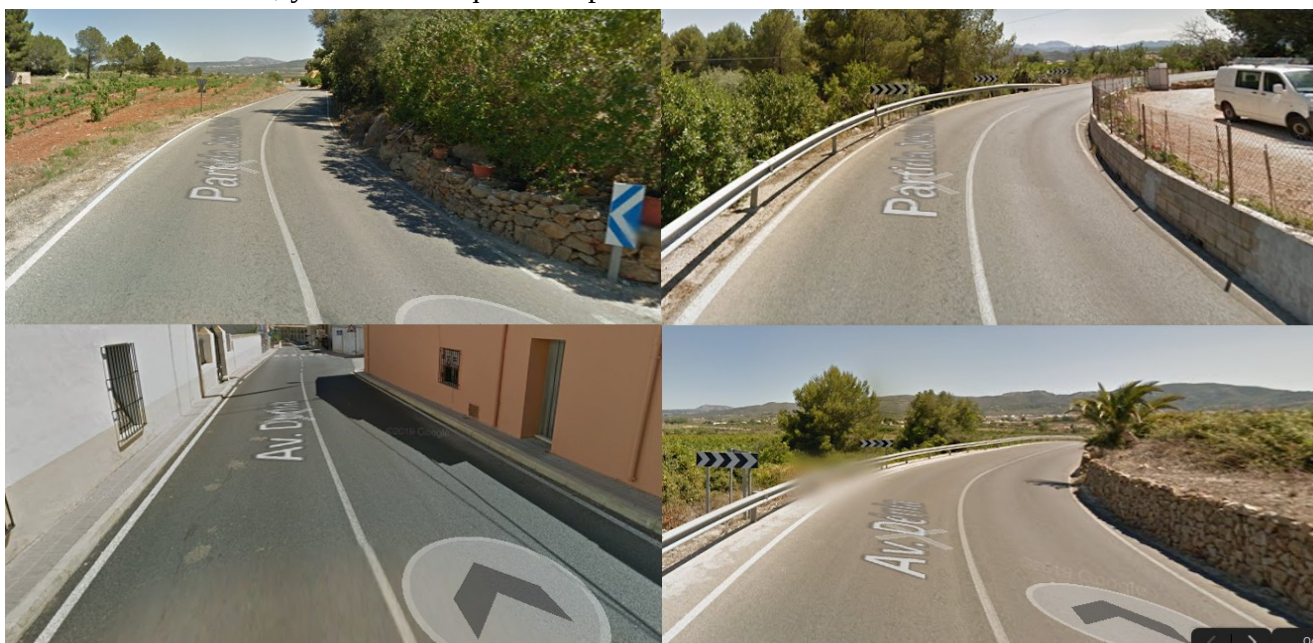
CV-738 Gata de Gorgos - Jesus Pobre, márgenes.

- A lo largo de toda la carretera, desde el cruce con la CV-735 hasta la rotonda de entrada a Gata de Gorgos estimamos que los arcenes en ningún momento miden mas de 70 cm de ancho, pero en muchos tramos son muy inferiores o inexistentes, lo que hace extremadamente peligroso circular a pie o en bicicleta e incluso detener un vehículo por causa de avería. En la travesía hay tramos de acera también de 70 cm o inferiores, y sin arcenes que las separen de la calzada: