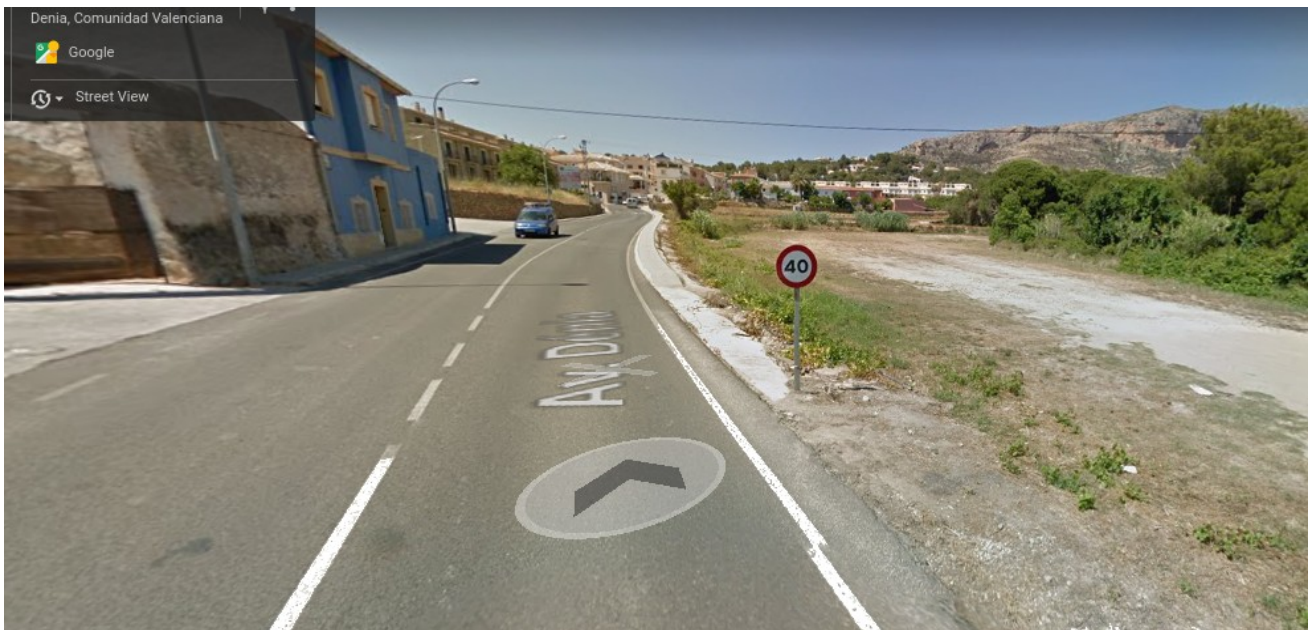
Señal de limitación de velocidad entrando desde el sur.