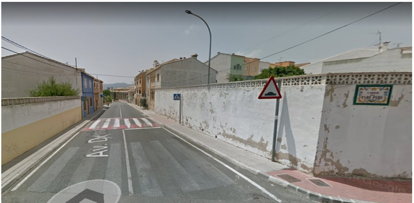
Un paso sobreelevado, señalizado como de peatones.

Esta Asociación de Vecinos ha recogido, sin embargo, numerosas quejas de lo residentes en las que manifiestan que a pesar de la señalización, de los pasos sobreelevados y de las mas elementales normas de prudencia se observa a diario que un alto porcentaje de los vehículos que circulan por ese tramo rebasan esa limitación de 40 Km/h, y también hemos observado que no parece haber nunca controles de velocidad por parte de la autoridad.