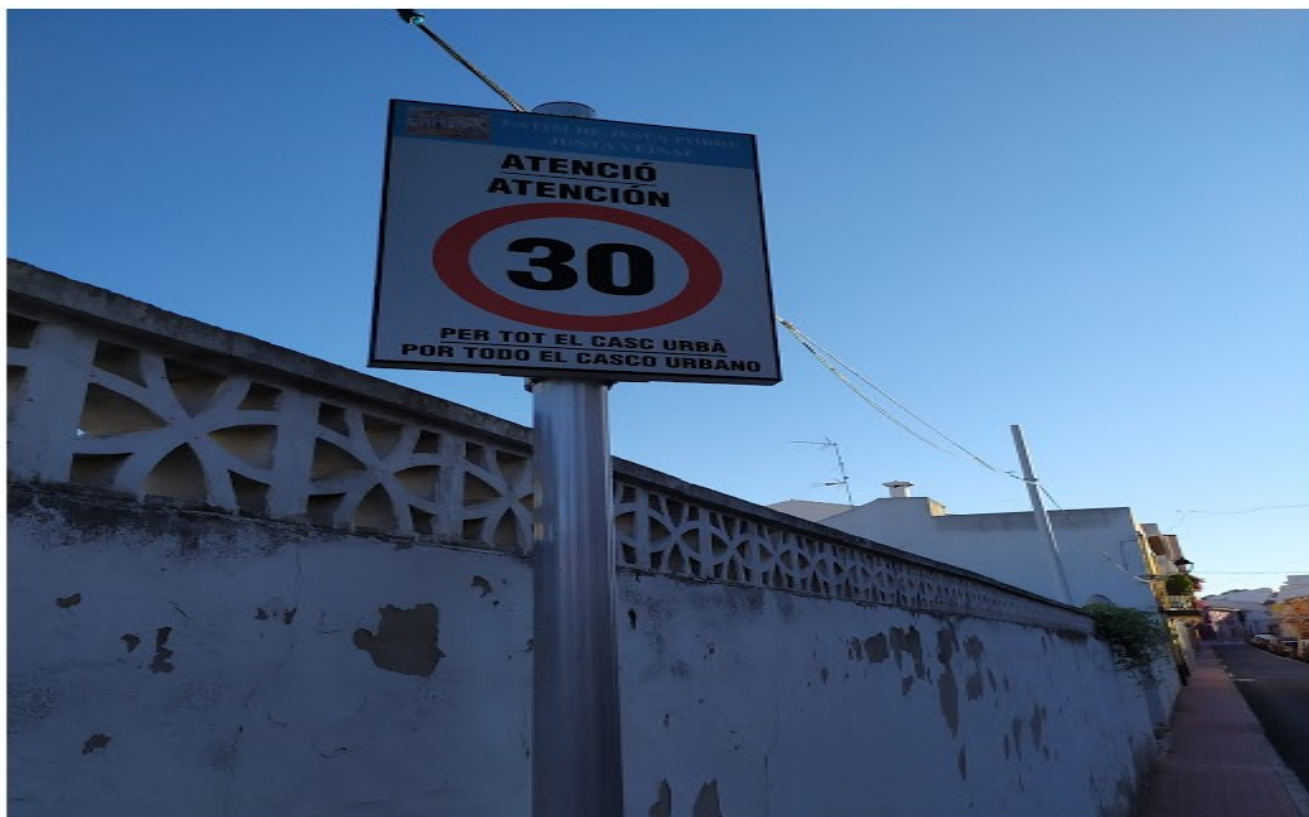
Zona 30 en todo el casco urbano

- Además, los vecinos creemos que este tramo es una travesía urbana en la que la norma general debería limitar la velocidad a 30Km/h, tal y como esta señalizado al inicio de las calles principales del pueblo y establecido por normativa municipal.