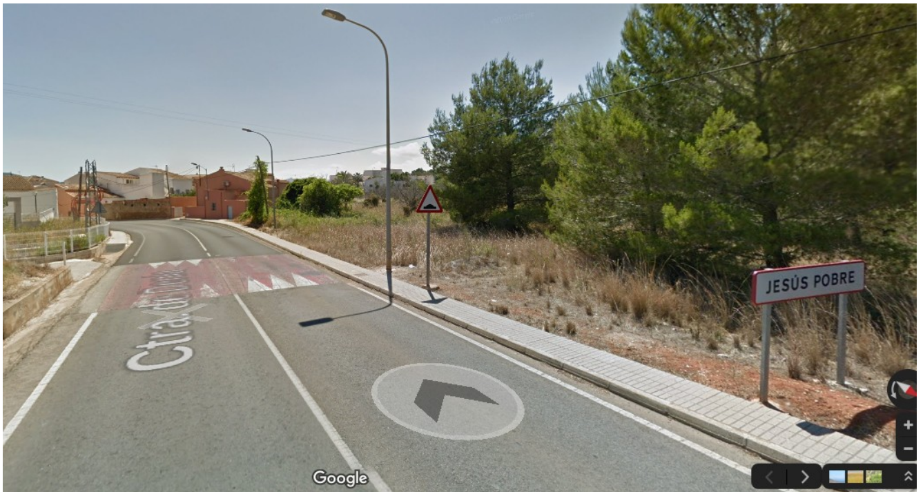
Primer paso sobreelevado entrando por el norte, no señalizado como paso de peatones.

- En todo este tramo, además, hay tres pasos sobreelevados de los cuales solo uno de ellos está señalizado como paso de peatones: