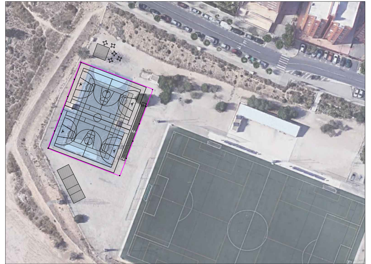
EMPLAZAMIENTO DE LA NUEVA ACTUACIÓN EN PARCELA