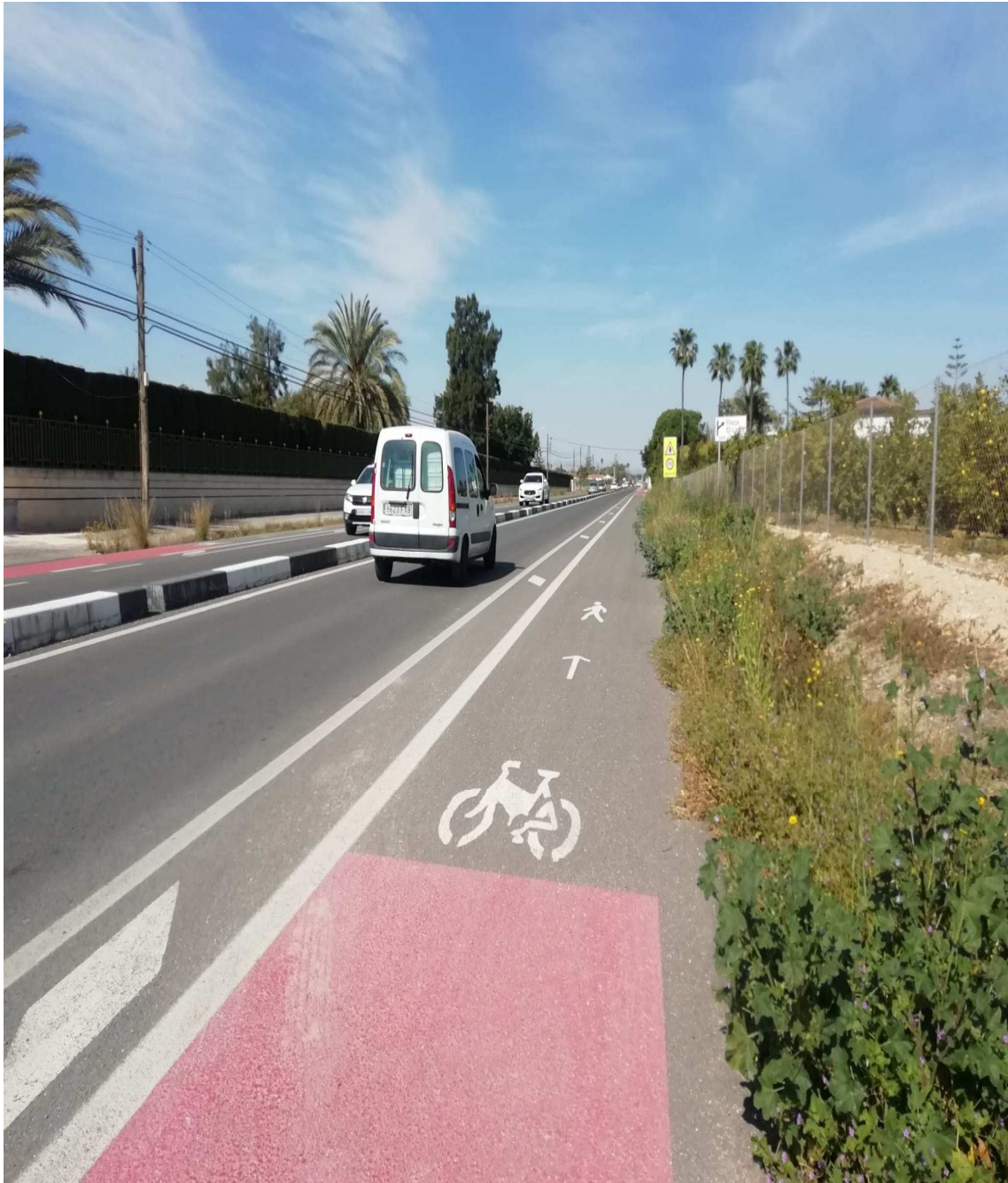
Otro modelo de carril bici sin obstáculos CV-865