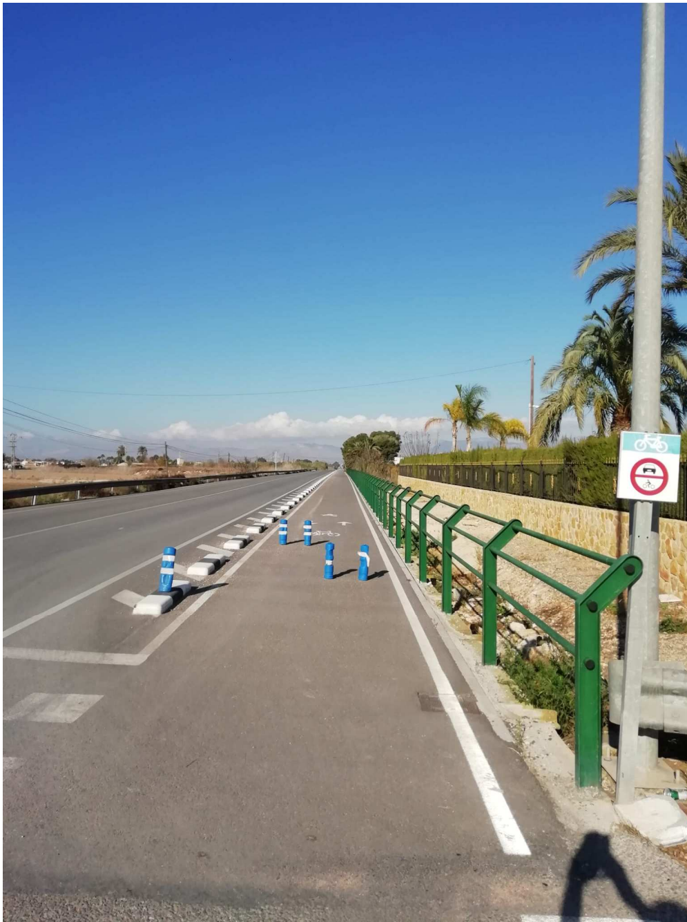
Una alternativa a los pilones de hormigón, son los bolardos de plástico.