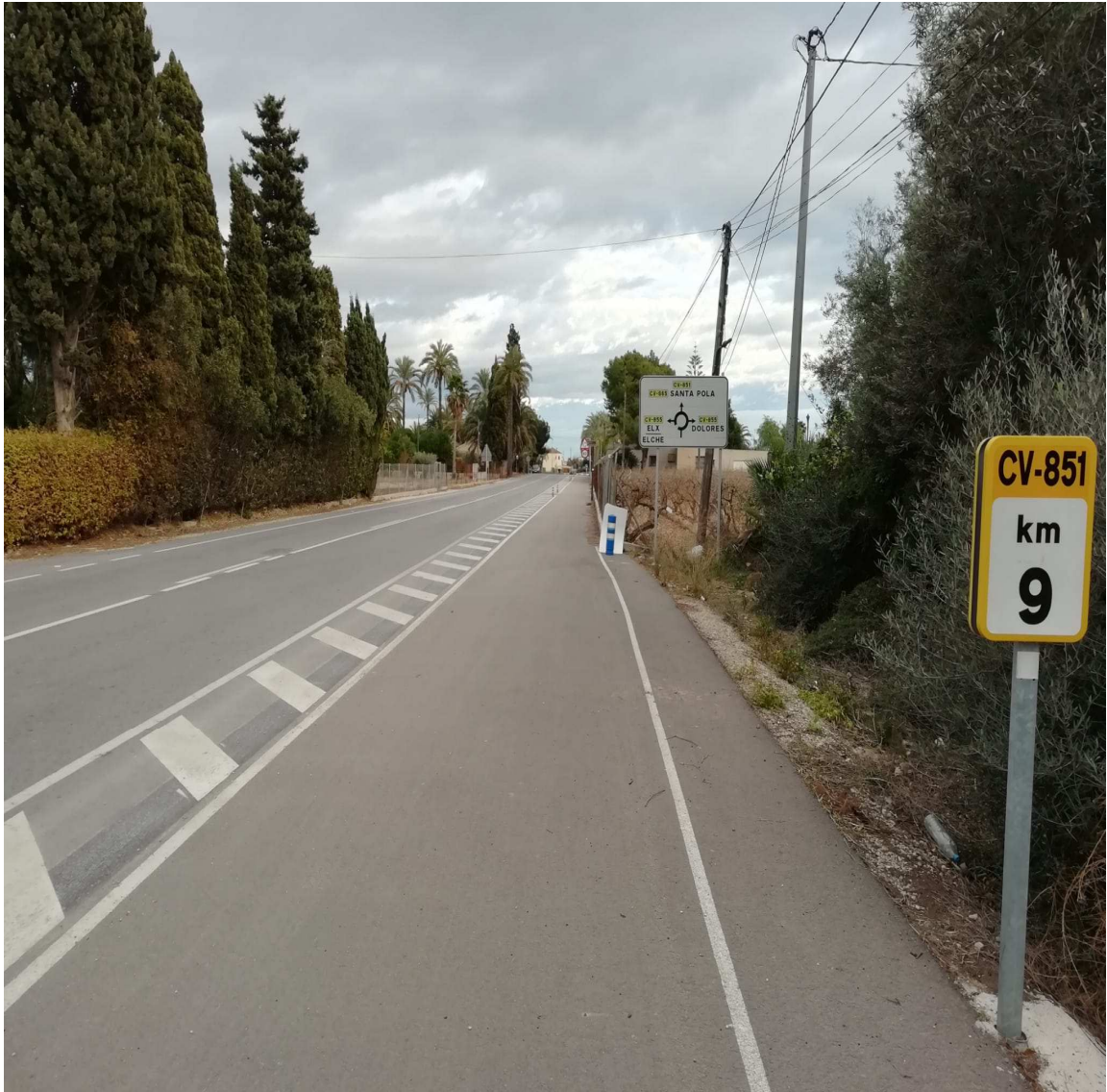
Un buen modelo de carril bici.