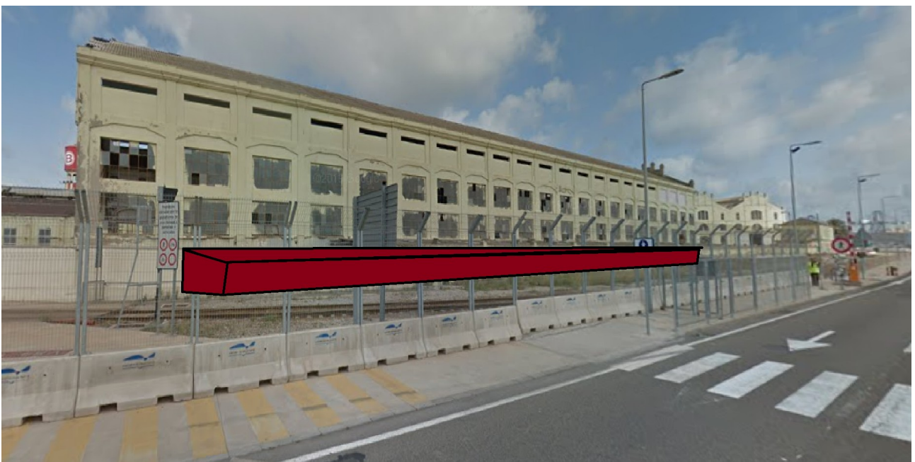
Figura 1: Edifici proposat per a remodelació i transformació com a estació VLC-Terminal de Creuers amb andana. Al fons a la dreta la nova terminal de creuers.