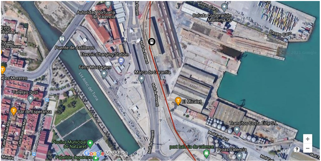
Figura 3: Localització estació VLC-Terminal de de Creuers