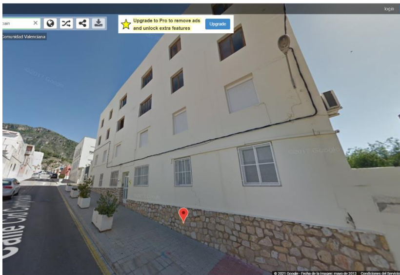
Antics habitatges del col·legi CEIP Magraner a tavernes.